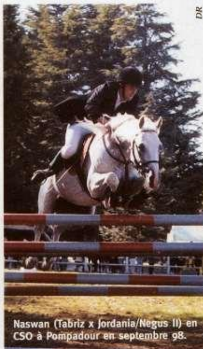
Naswan (Tabriz x Jordania/Negus II) en CSO à Pompador en septembre 98.