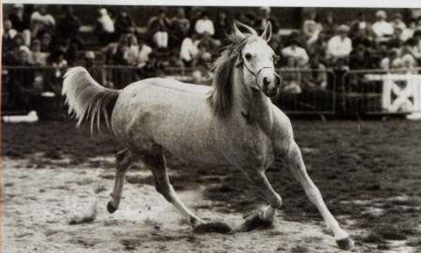
Harmonia (El Marrufo x Magenta/Zanduco) jeune.

Didier Cabrol mène toujours de front un emploi à plein temps et l'élevage l'accaparrant de plus en plus au gré de l'augmentation du cheptel. En 1987, avec son épouse Brigitte qui travaille elle aussi à l'extérieur, ils réussissent à acquérir une maison à restaurer avec 7 hectares de prairies. Le cap est franchi, l'investissement est important, réfection des bâtiments existants, construction d'un immense hangar, aménagements divers, mais